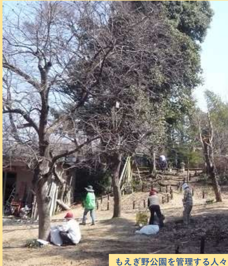
もえぎ野公園を管理する人々