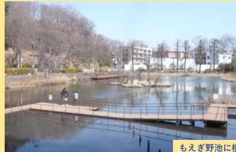
もえぎ野池に棲む鶺鴒(バン)