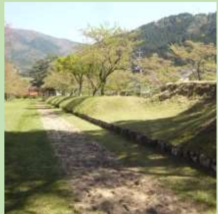
鷲原八幡宮流鏝馬馬場