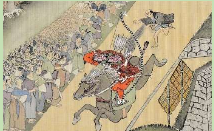
津和野百景図に描かれた流鏝馬神事