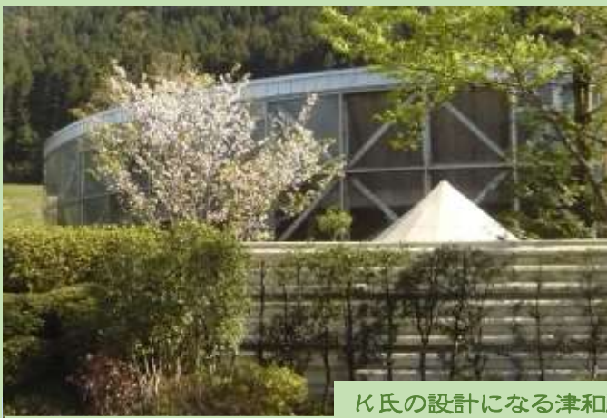
K氏の設計になる津和野温泉なごみの里