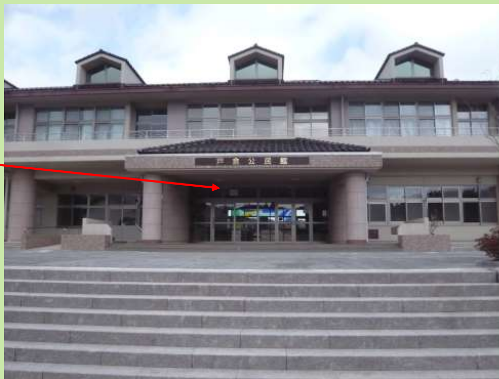
戸倉公民館（旧戸倉中学校）

6年目の3.11に南三陸町志津川地区を訪ねたところ、町中に人と車が溢れていて、車が渋滞し駐車することすらできなかった。仕方なく戸倉地区へ回ってみたものの、すでに昔の面影は殆ど残っていなかった。