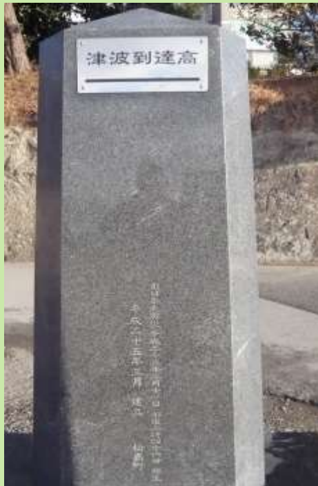
この碑は東日本大震災で被災した方々の慰霊と被害を後世に伝え、来たるべき災害に備える気持ちを持ち続けるために建立したものです