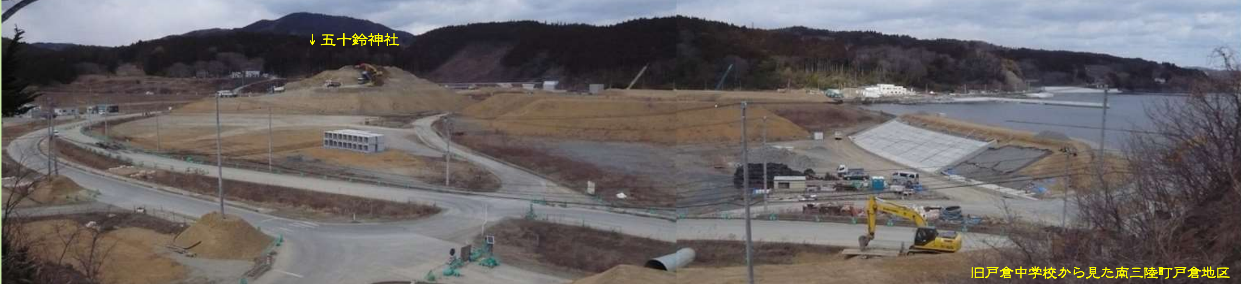
旧戸倉中学校から見た南三陸町戸倉地区