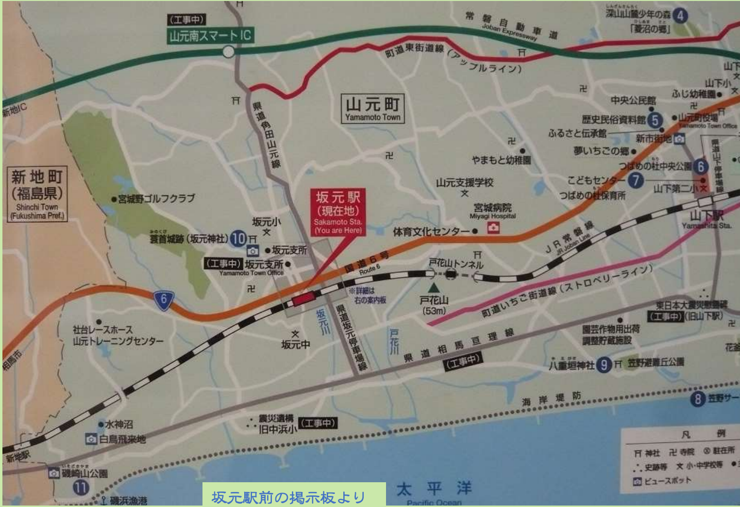
坂元駅前の掲示板より