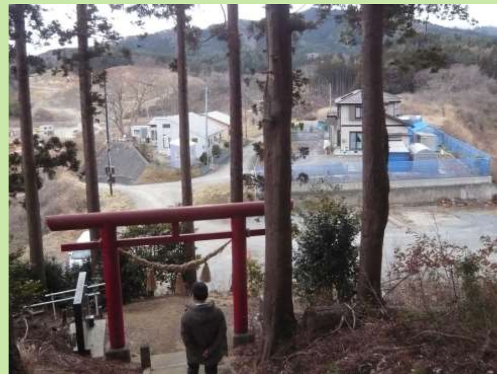
五十鈴神社から見た宇津野高台地区