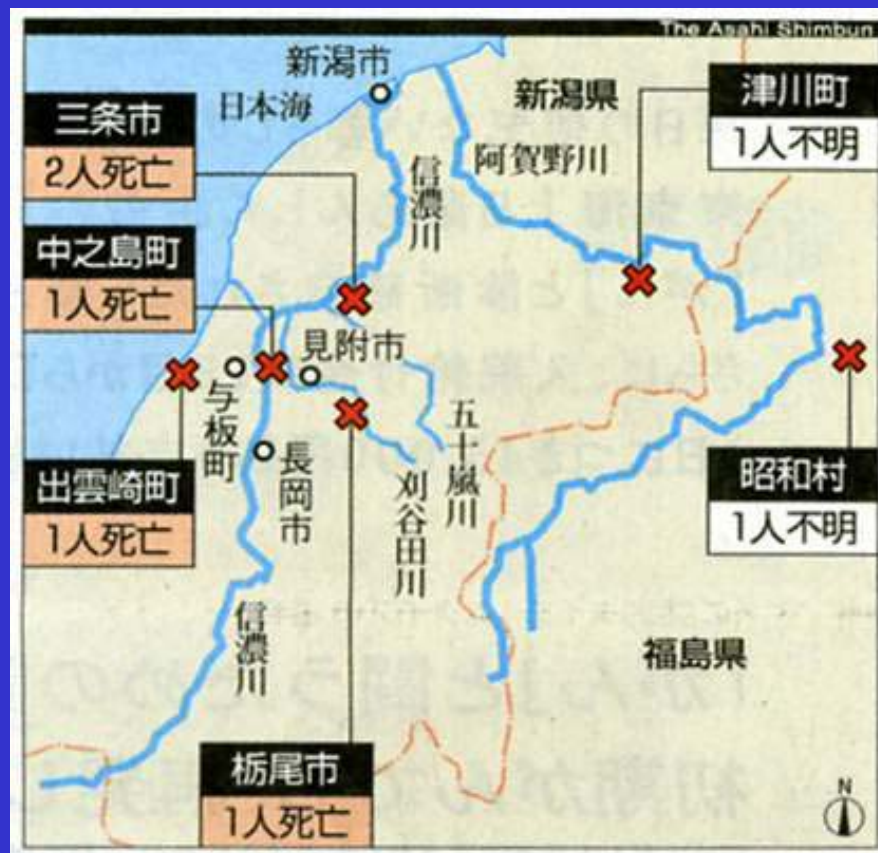
朝日新聞(7月14日夕刊)