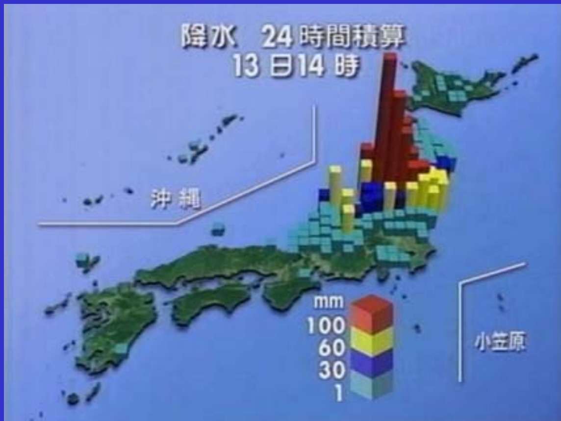
N H K 特報首都圏(7月16日放映)