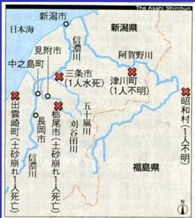
朝日新聞(7月14日朝刊)