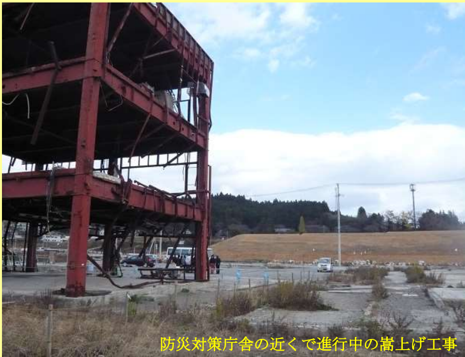
防災対策庁舎の近くで進行中の嵩上げ工事