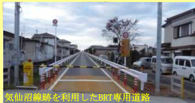
気仙沼線跡を利用したBRT専用道路