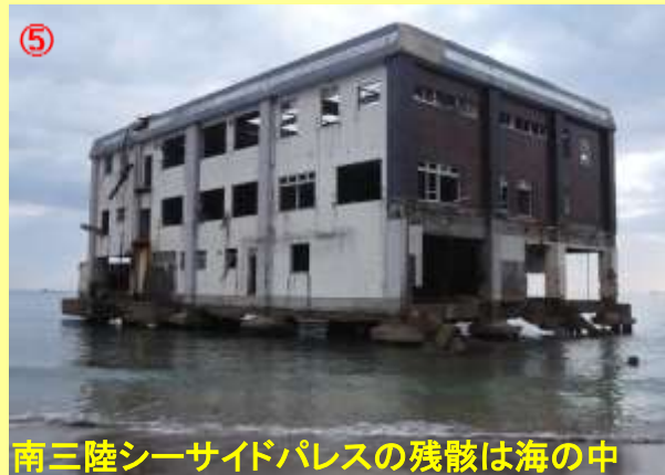
南三陸シーサイドパレスの残骸は海の中