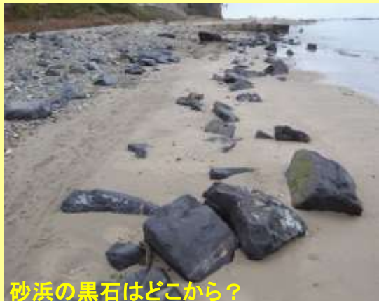
砂浜の黒石はどこから？