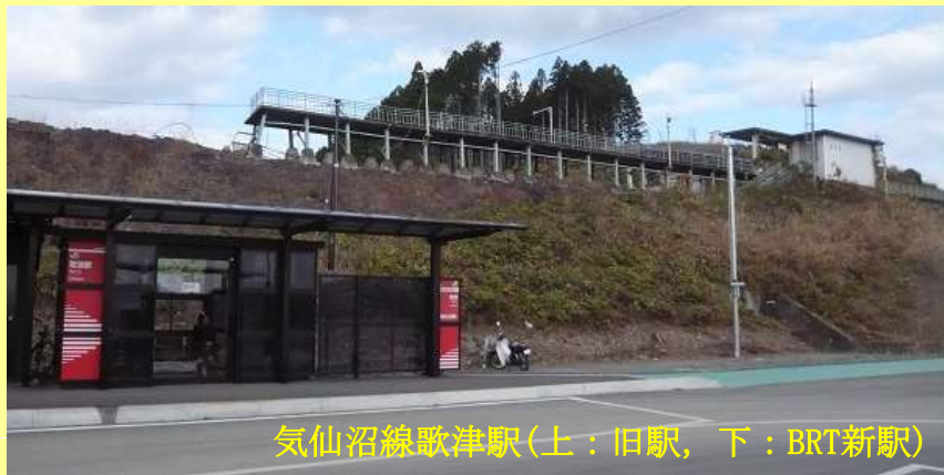
気仙沼線歌津駅(上：旧駅，下：BRT新駅)