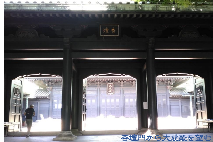
杏壇門から大成殿を望む