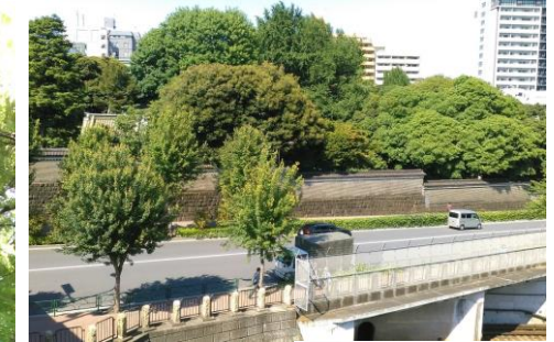
← 聖橋から湯島聖堂を望む