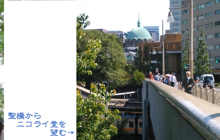
聖橋からニコライ堂を望む→