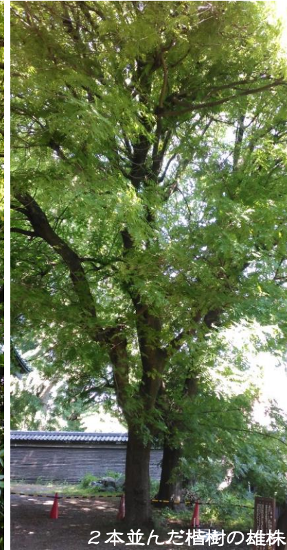
2本並んだ楷樹の雄株