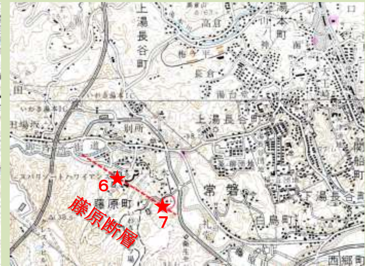
1 : いわき市田人支所 2~7 : 今回の断層変位・被害確認位置 原図は 1/50,000 地形図 [川部], [小名浜]