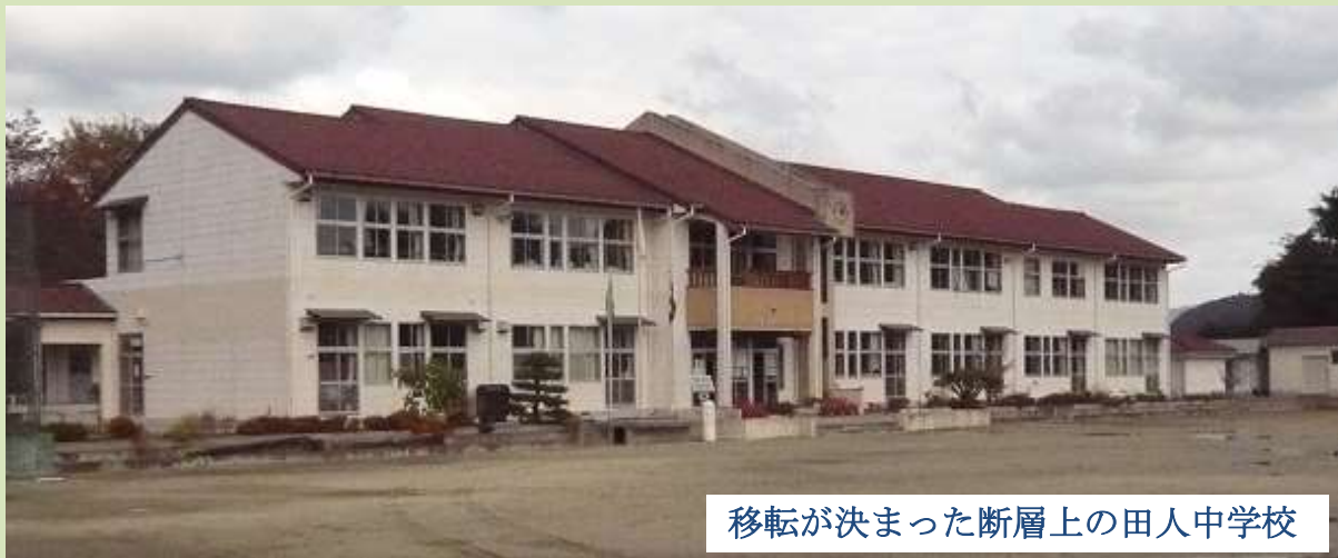
移転が決まった断層上の田人中学校