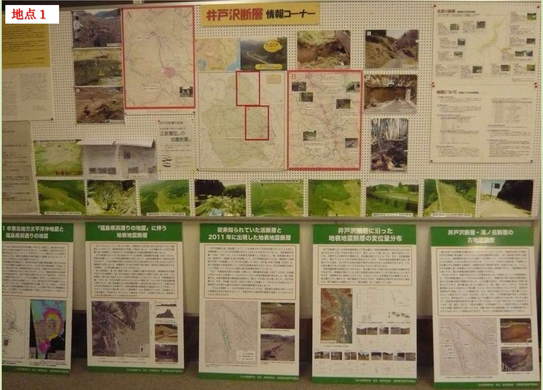
いわき市田人支所に設けられた井戸沢断層情報コーナー