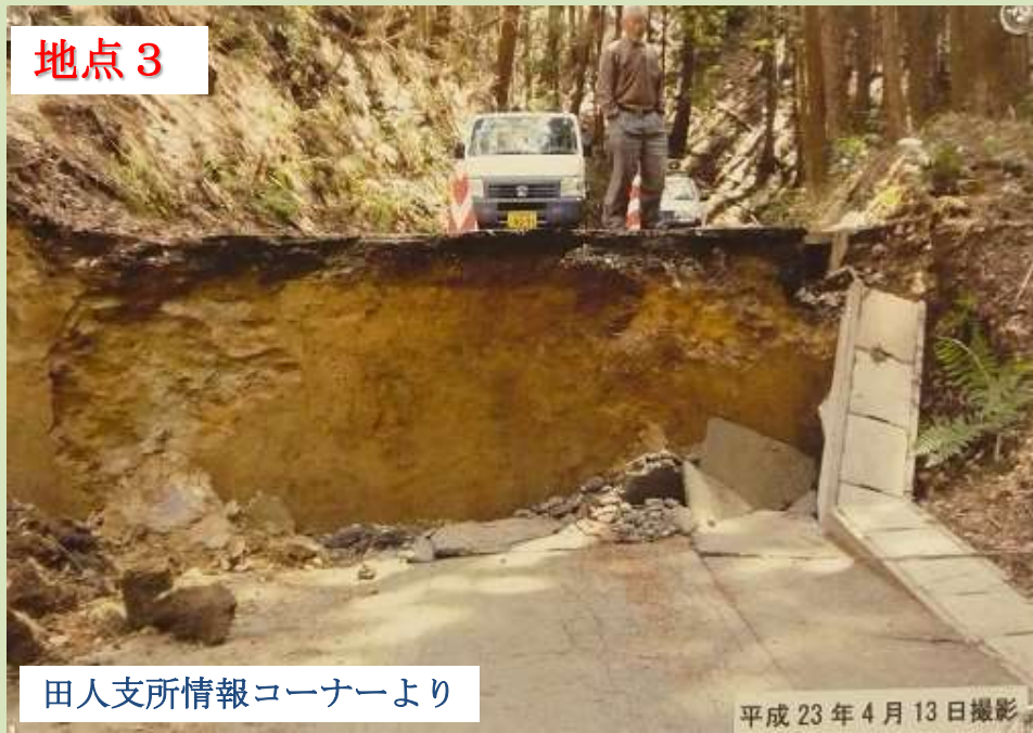
田人支所情報コーナーより