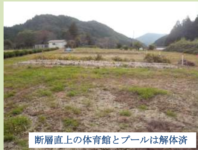
断層直上の体育館とプールは解体済