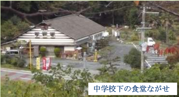
中学校下の食堂ながせ