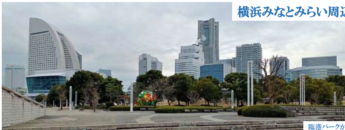
臨港パークから見た高層建築群