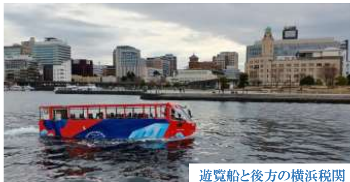
遊覧船と後方の横浜税関