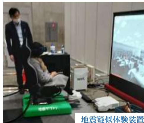
地震疑似体験装置