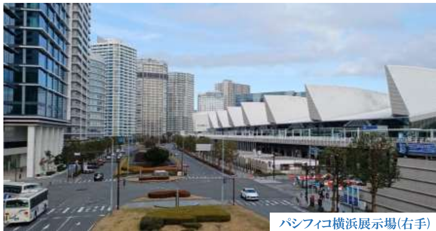
パシフィコ横浜展示場(右手)