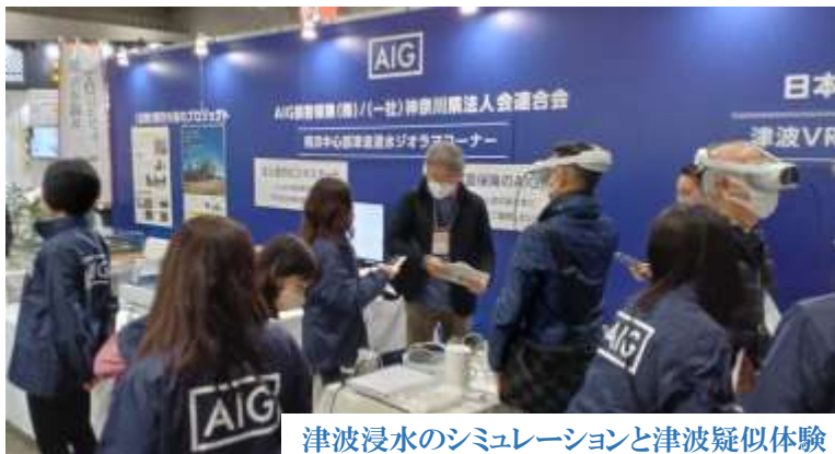
津波浸水のシミュレーションと津波疑似体験