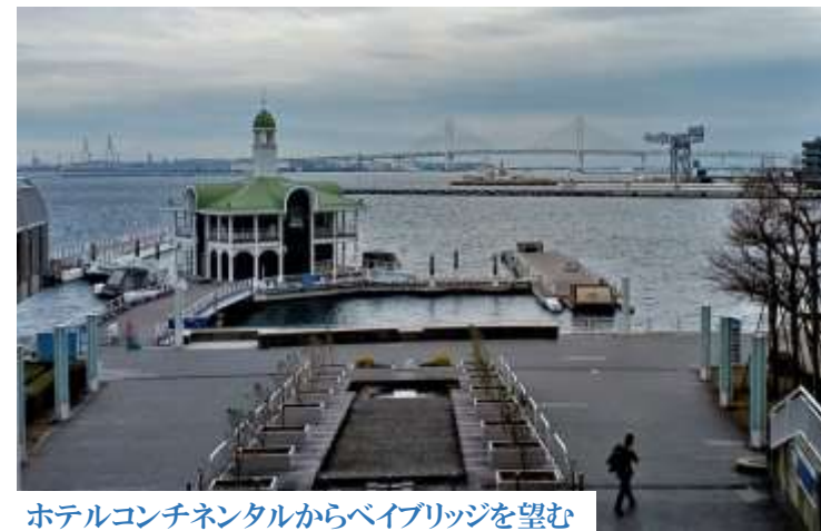
ホテルコンチネンタルからベイブリッジを望む