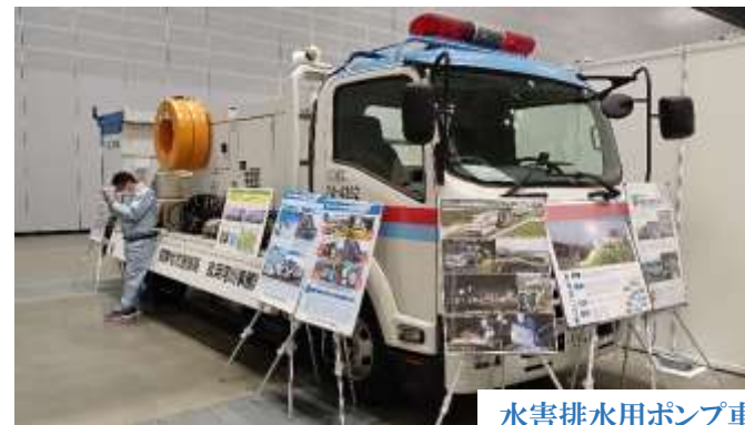
水害排水用ポンプ車