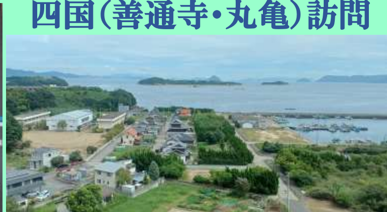
瀬戸大橋を渡る電車から右手遠方に屋島が見える