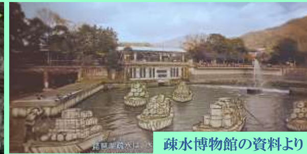
疎水博物館の資料より