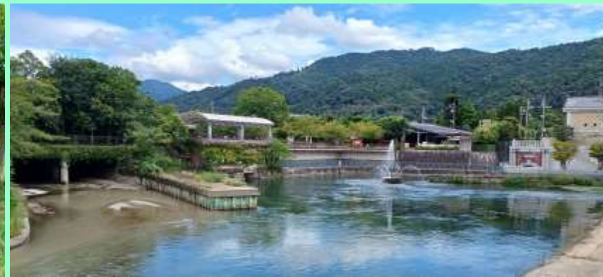
琵琶湖疎水の船溜まり