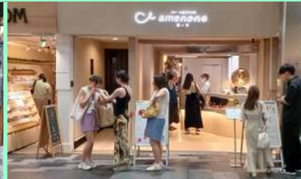
寺町商店街のスイーツに集まる観光客