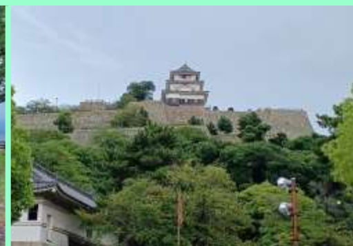
丸亀城の天守閣と石垣