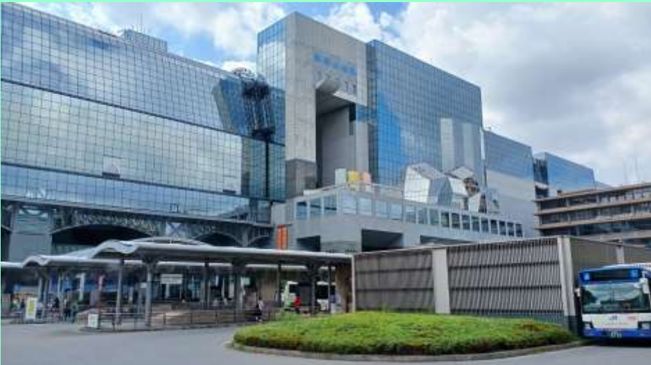
JR京都駅の駅舎外観