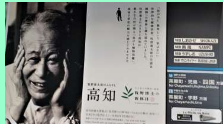
岡山駅のポスター『牧野富太郎の待つ高知へ』