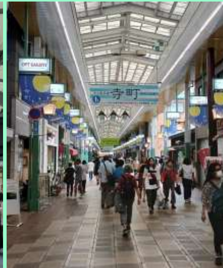
寺町商店街のアーケード