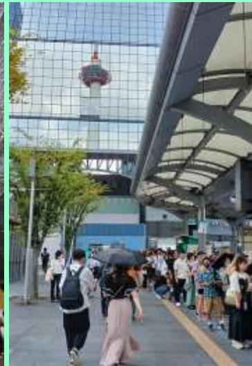
駅舎に映る京都タワー