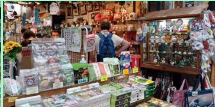
寺町商店街の土産物屋