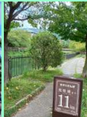
琵琶湖までの道標