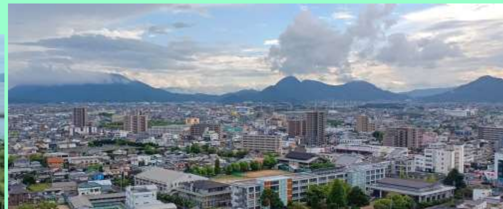
丸亀城から善通寺方面を望む(左手に象頭山, 中央に我拝師山)