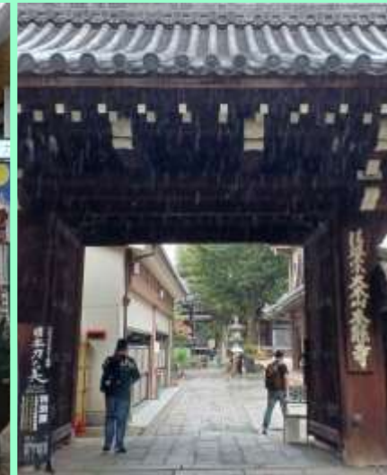
寺町商店街の中の本能寺