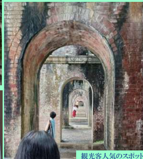
観光客人気のスポット