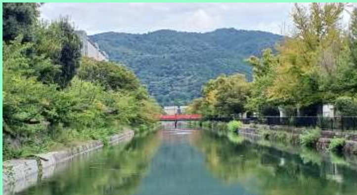
琵琶湖疎水と平安神宮橋