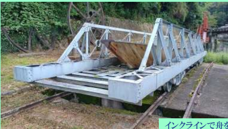
インクラインで舟を運ぶ台車