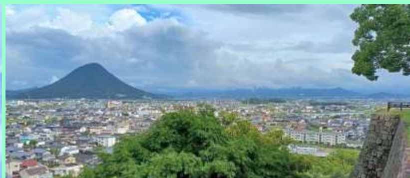
丸亀城から讃岐富士を望む