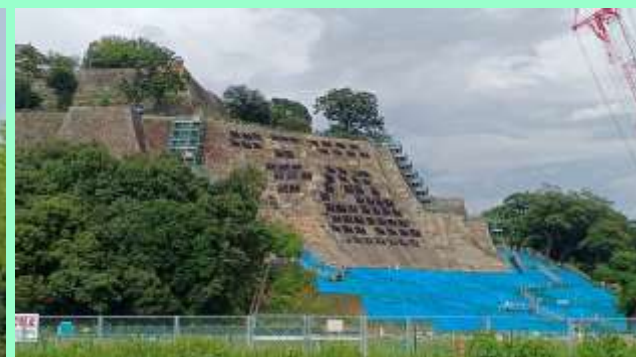
丸亀城石垣の修復工事