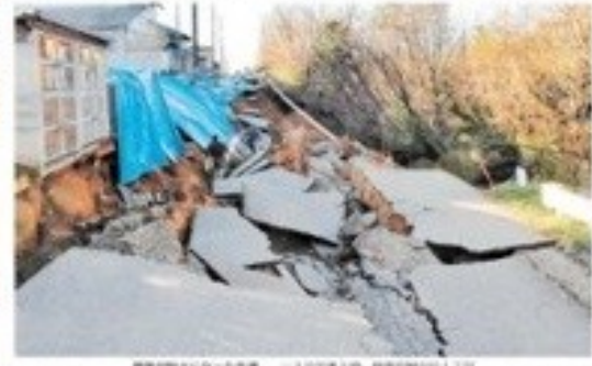
美川の津波被害現場。道路が壊滅的な被害を受けた。

1.1大震災で、美川住民が避難した様子。着の身着のまま避難したと報告されている。