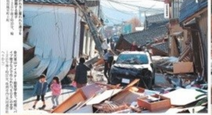
震災後の福島県いわき市、被災した街並み →2月28日15時30分、福島県いわき市