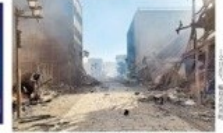
震災後の福島県いわき市、被災した街並み →2月28日15時30分、福島県いわき市