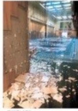
和倉温泉の旅館内。壁崩れやガラスの散乱が確認された。

和倉温泉の旅館で、浴衣を着た客が「どうすれば」と悩んでいる様子。壁崩れやガラスの散乱が確認された。