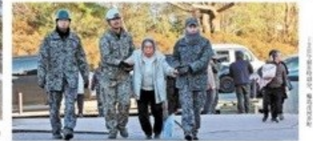
被災地、自衛隊員が避難民を支援 →2月28日15時30分、福島県いわき市