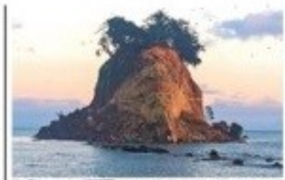
見附島の崩落現場。崩落した岩塊が周囲に散らばっている。背景には海と空が広がる。