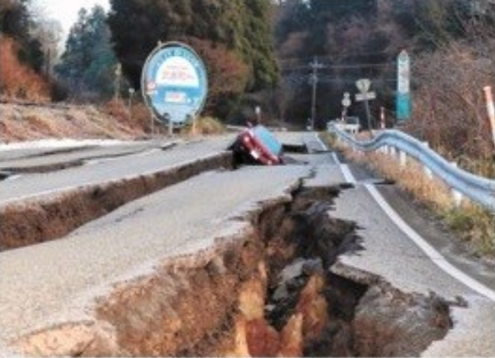
道路の陥没を受けたとみられる茨城県市の街並み →2月28日1時30分（茨城県鹿嶋市〜つくば）