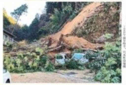
被災地、大規模な土砂崩れが道路を遮断 →2月28日15時30分、福島県いわき市