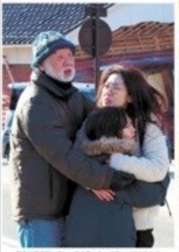
震災地帯避難所が溢れ、身を寄せ合って居るのを待つ家族 →2月28日15時30分、福島市0474号