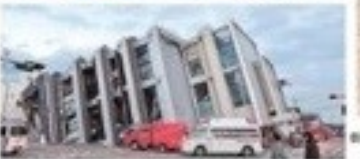
被災した福島県の工業団地の様子 →2月28日17時30分、福島県いわき市