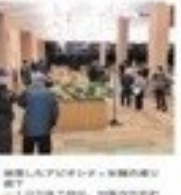
ララバハウスの開放的な空間。