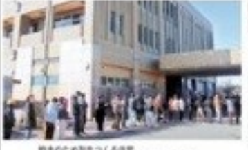
避難のため列を待つ避難民 →2月28日15時30分ごろ、茨城県鹿嶋市