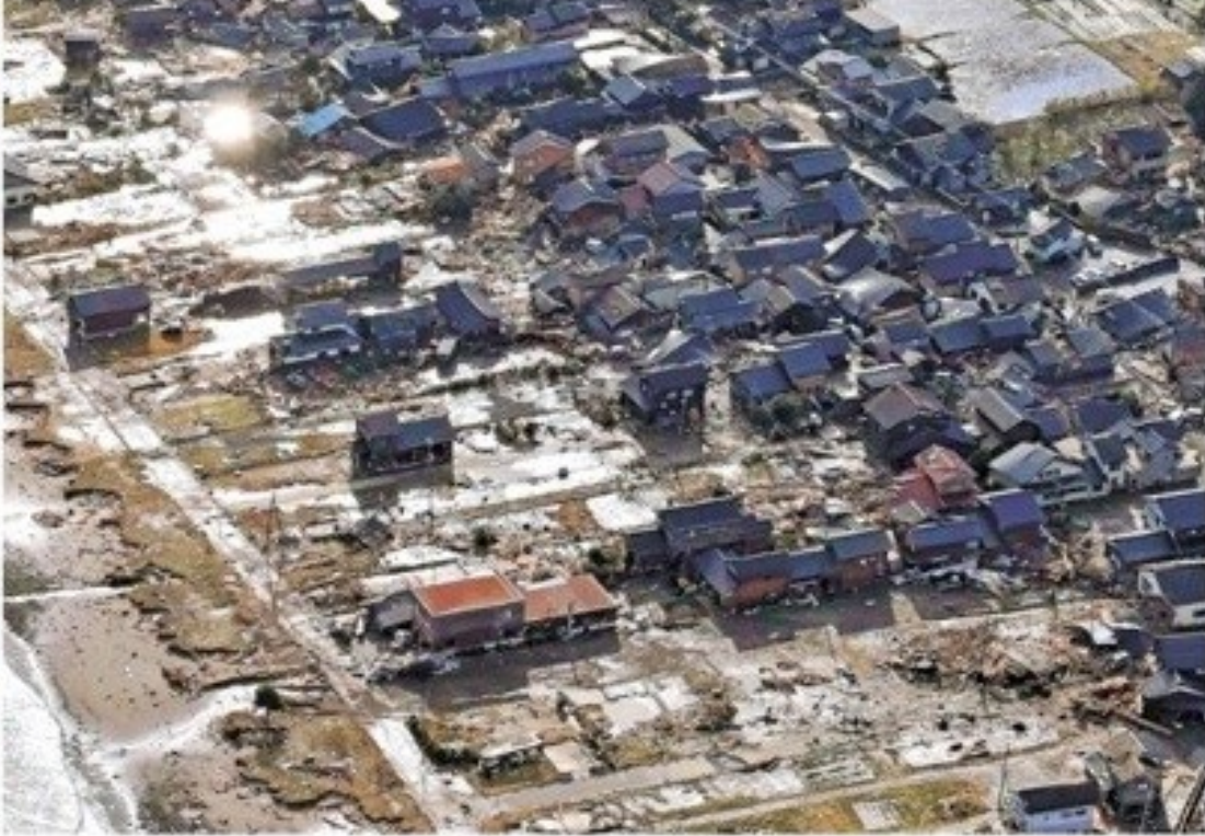
震災の被害を受けたとみられる茨城県市の街並み →2月28日1時30分（茨城県鹿嶋市〜つくば）