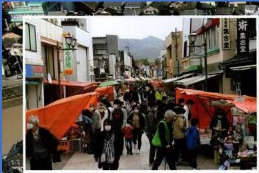
地域色豊かな商品が並び、大勢の観光客でにぎわう朝市通り =2021年11月