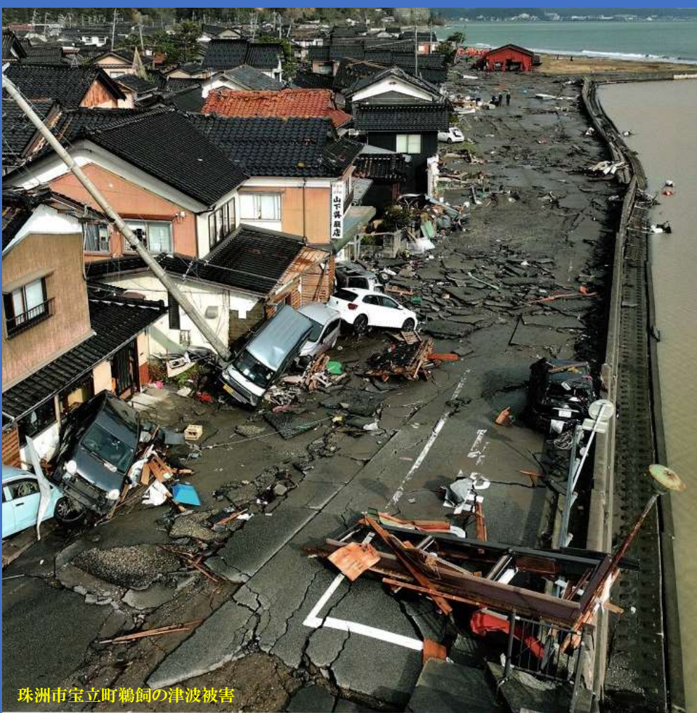
珠洲市宝立町鶴飼の津波被害