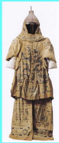
モンゴル型鎧兜 と鎧の内側(右)