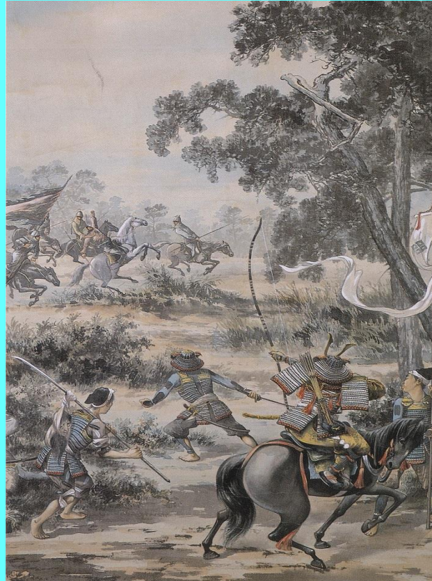
少式影資敵の副将劉復亨を一矢にて斃ちする之図(同年)