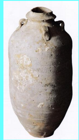
元軍壺 軍船が沈没した 鷹島沖から引き 上げられた。