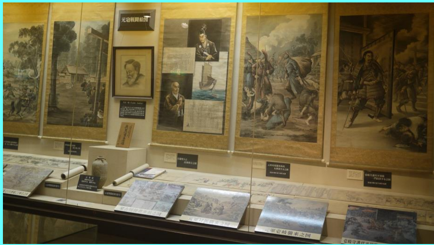
元寇史料館内の展示風景