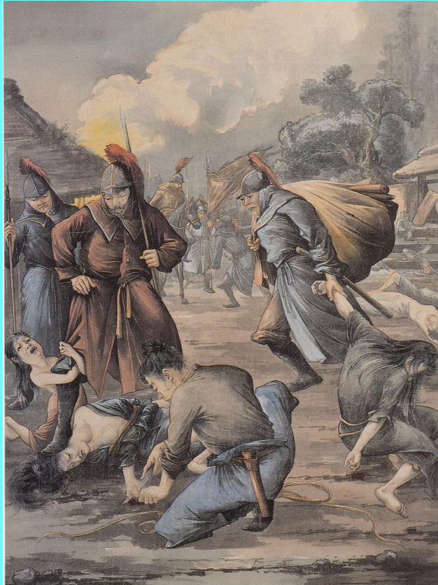
元軍対馬襲来島民を惨殺する之図(1896年)

矢田一嘯により作成された右の洋画は1904(明治37)年に完成した東公園の日蓮聖人銅像基壇のレリーフ『日蓮聖人一代記』の原画となっている。