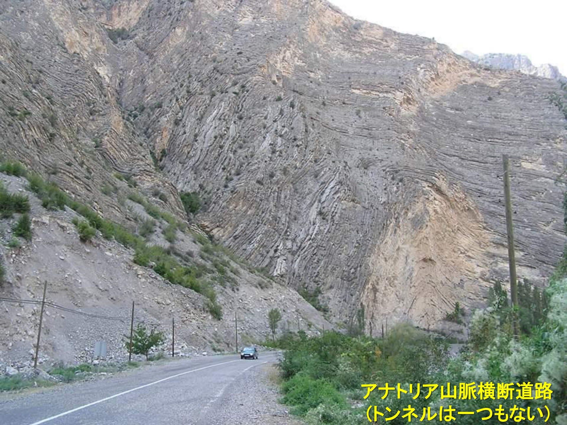
アナトリア山脈横断道路 (トンネルは一つもない)