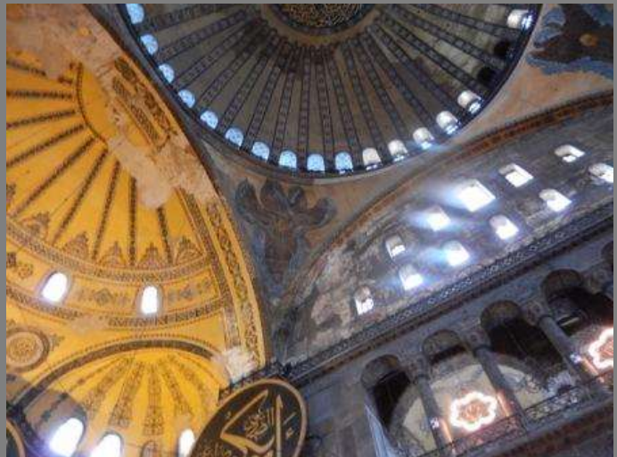
アヤソフィアの内部：写真は www.artlogue.net/ayasofia-istanblu より転載させていただいた。